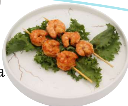
88. Gamberi alla griglia € 6,00