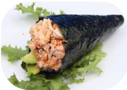
132. Temaki granchio € 3,50