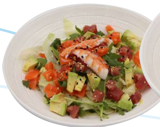
21. Insalata di pesce misto € 8,00