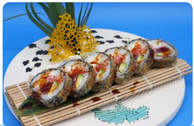
223. Maki fritto salmone, tonno, surimi, avocado, philadelphia € 10,00