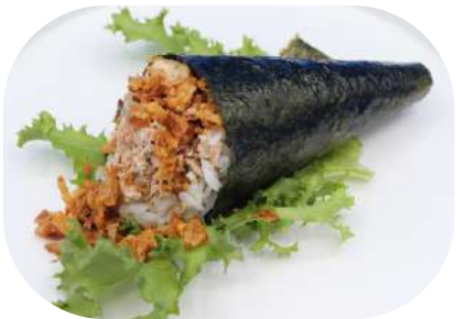
131. Temaki salmone cotto, philadelphia, cipolla croccante € 3,50