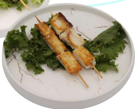
87. Pescespada alla griglia € 6,00