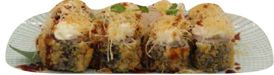
218. Hoso sake fritto salmone, philadelphia, kataifi € 8,00