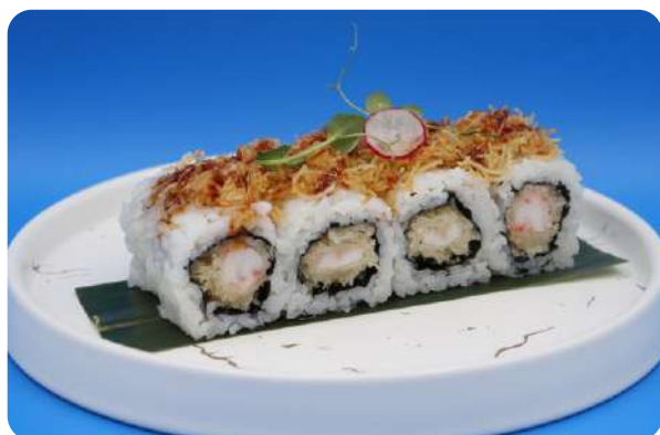
195. Kuni maki tempura di gamberi, tempura di patate € 10,00