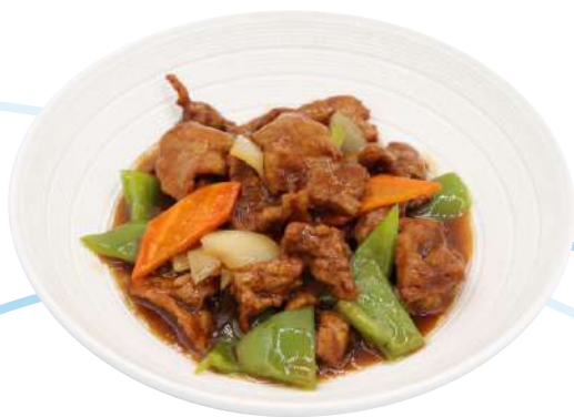
73. Vitello con peperoni e salsa al pepe nero € 8,00