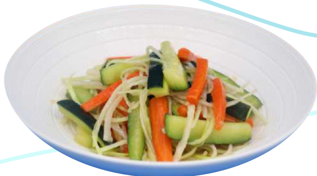
94. Verdure alla piastra € 5,00