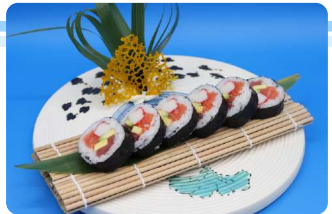
220. Futomaki mix salmone, tonno, surimi di granchio, avocado € 9,00