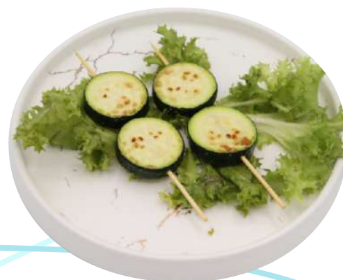
93. Zucchine alla piastra € 4,00