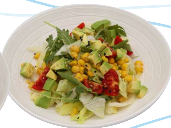
19. Yasai insalata € 5,00