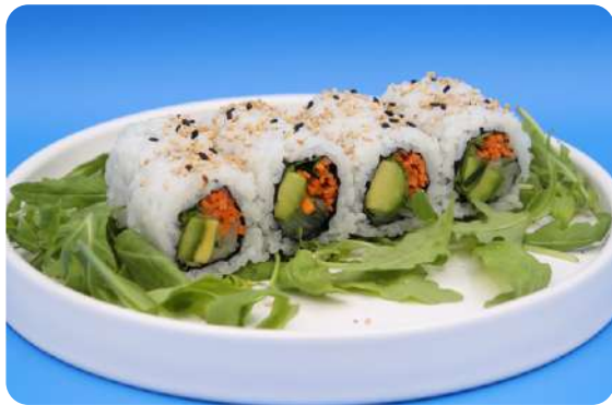
199. Yasai maki avocado, cetriolo, carote € 8,00