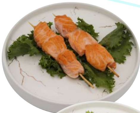
85. Salmone alla griglia € 6,00