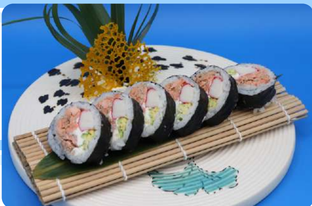
221. Futo maki cotto salmone cotto, granchio, philadelphia, avocado € 9,00