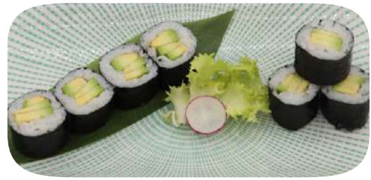
214. Hosomaki avocado € 4,00