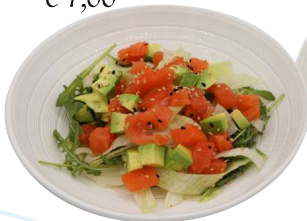
20. Insalata di salmone € 7,00