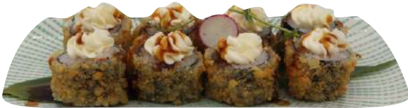
217. Hoso ebi fritto gamberi cotti, philadelphia € 7,00