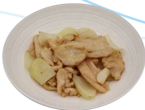
71. Pollo alla piastra pollo, cipolla € 6,00