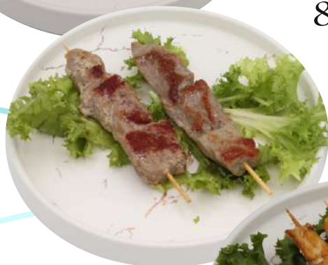
86. Tonno alla griglia € 6,00