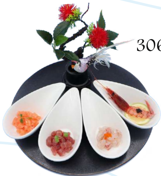
306. Tris tartare € 10,00

Piatti speciali massimo 2 piatti a persona, a tua scelta