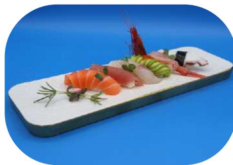
124. Nigiri misto 6pz € 10,00