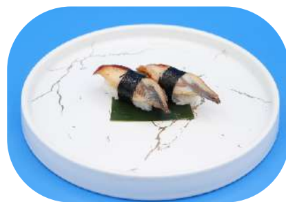
116. Anguilla € 3,50