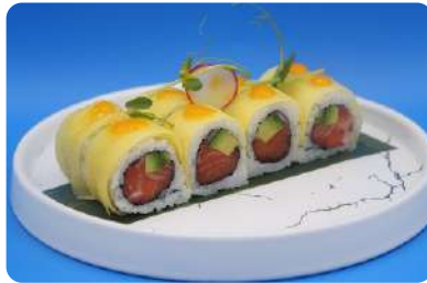
169. Mango maki salmone, avocado, philadelphia, mango € 10,00