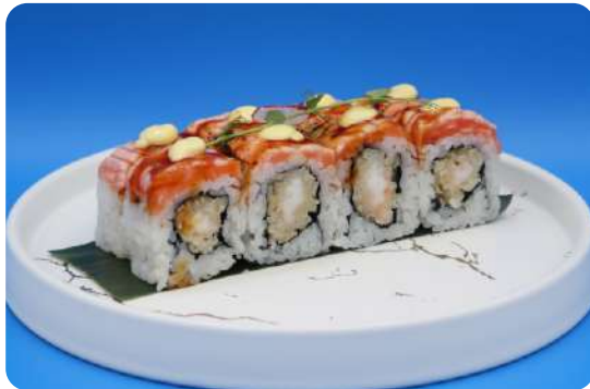
197. Dragon maki tempura di gamberi, salmone scottato € 12,00