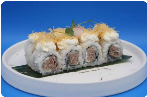
191. Tonno tempura maki tonno fritto , philadelphia, kataifi € 11,00