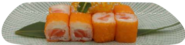
215. Hosomaki salmone philadelphia € 8,00