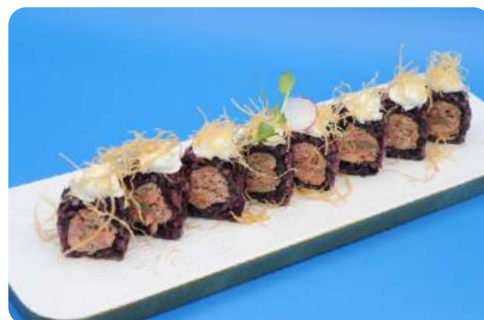
206. Nero miura maki riso nero, salmone cotto, philadelphia, kataifi € 11,00