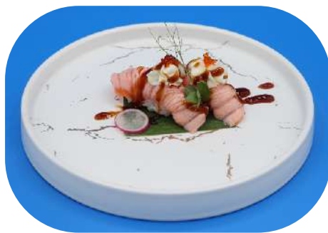
120. Salmone scottato philadelphia € 4,00