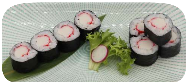
209. Hosomaki surimi di granchio € 5,00