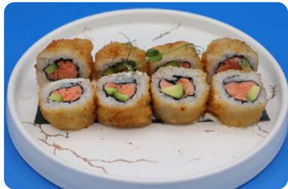
192. Uramaki fritto salmone, avocado, philadelphia € 10,00