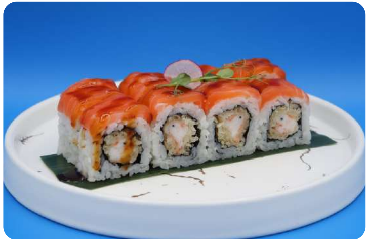
196. Tiger maki tempura di gamberi, salmone € 11,00