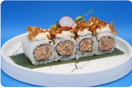
189. Cipolla miura maki salmone cotto, philadelphia, cipolla croccante € 10,00