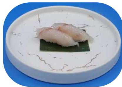
113. Spigola € 3,50