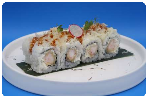
194. Ebi philadelphia maki gamberi fritti, philadelphia, tempura € 9,00