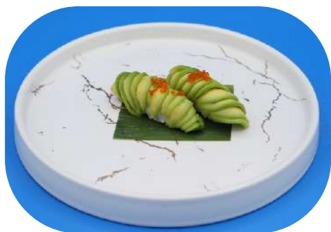
117. Avocado € 2,50