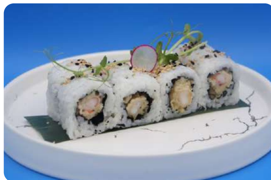
193. Tempura maki gamberi fritti € 8,00