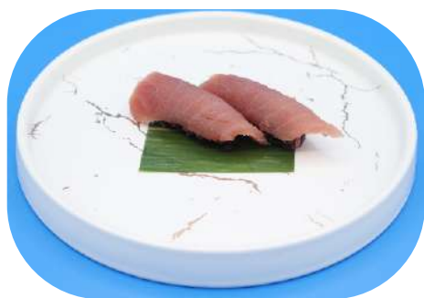
119. Riso nero Tonno € 3,50