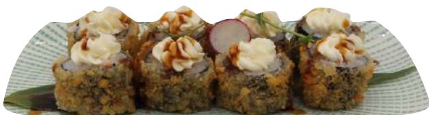
217. Hoso ebi fritto gamberi cotti, philadelphia € 7,00