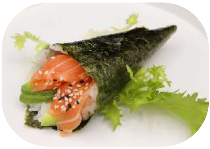
125. Temaki salmone € 3,50