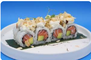
172. Mandorla maki salmone, avocado, philadelphia, mandorle € 10,00