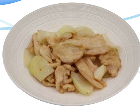
71. Pollo alla piastra pollo, cipolla € 6,00