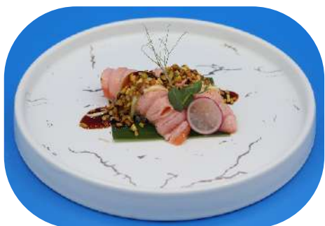
121. Salmone scottato pistacchio € 4,00