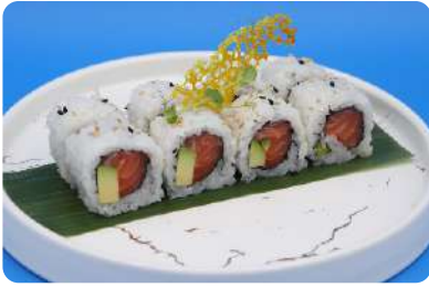
168. Salmone avocado maki salmone, avocado € 8,00