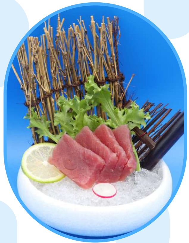
162. Sashimi tonno € 11,00