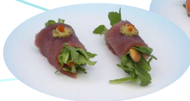
110. Roll tonno rucola involtini di tonno con rucola 2 pz € 5,00