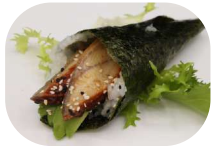
133. Temaki anguilla € 4,00