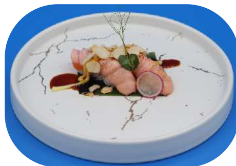
122. Salmone scottato mandorla € 4,00