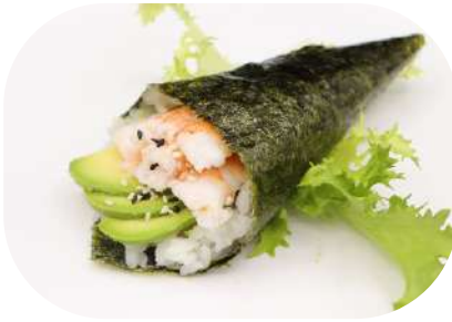
129. Temaki gamberi cotti € 3,50