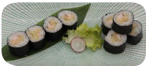
211. Hosomaki tempura gamberi € 6,00