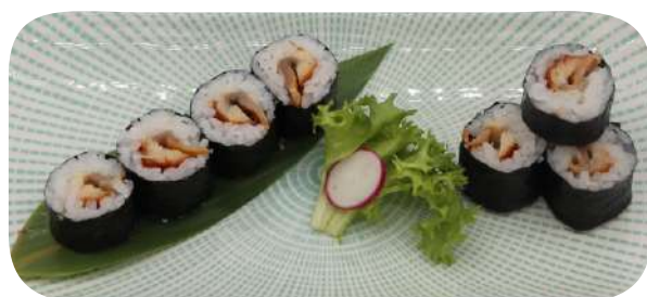
212. Hosomaki anguilla € 6,00