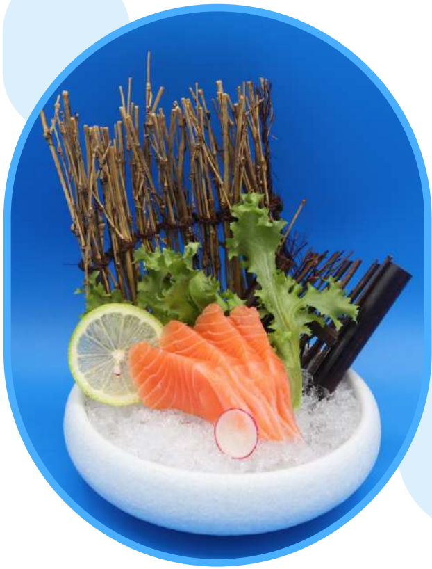
161. Sashimi salmone € 10,00