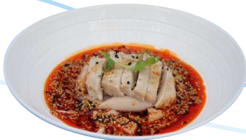
72. Pollo con salsa all'olio di peperoncino € 6,00