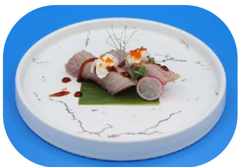
123. Tonno scottato philadelphia € 4,00