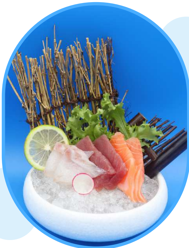
163. Sashimi misto € 12,00