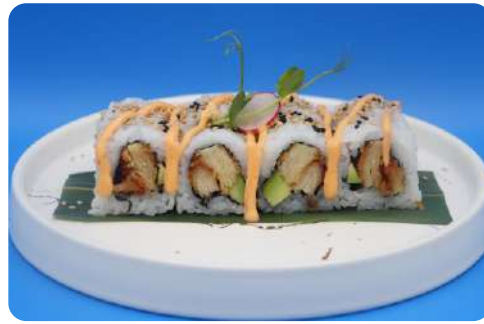
200. Pollo fritto maki pollo fritto, avocado, maionese € 10,00