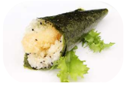
130. Temaki tempura gamberi € 3,50