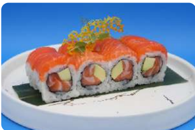
173. Sake maki interno salmone e avocado, esterno salmone € 12,00