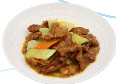
74. Vitello al curry vitello con verdure e curry € 8,00