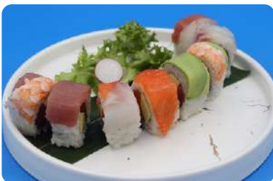
174. Arcobaleno maki interno salmone e avocado, esterno pesce misto € 12,00