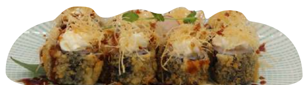
218. Hoso sake fritto salmone, philadelphia, kataifi € 8,00