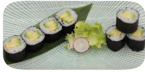
214. Hosomaki avocado € 4,00