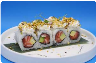
171. Pistacchio maki salmone, avocado, philadelphia, pistacchio € 10,00