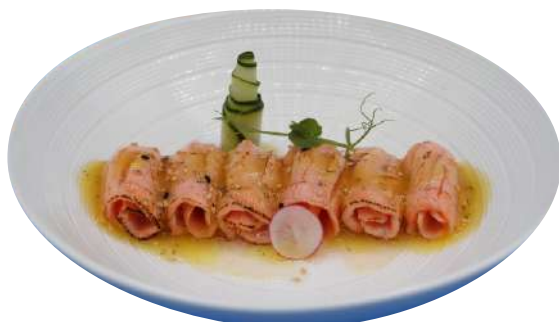
159. Carpaccio di salmone scottato in salsa di frutta € 7,00