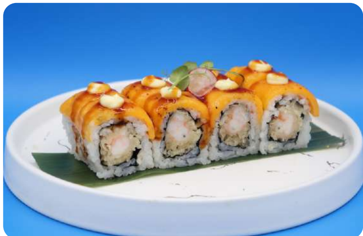
198. Cheddar ebi maki tempura di gamberi, cheddar € 11,00