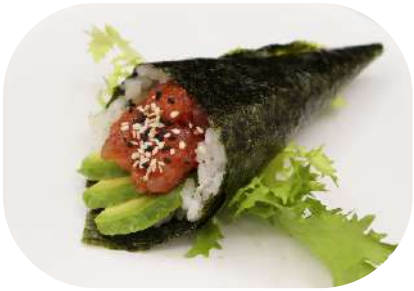
128. Temaki spicy tonno € 3,50