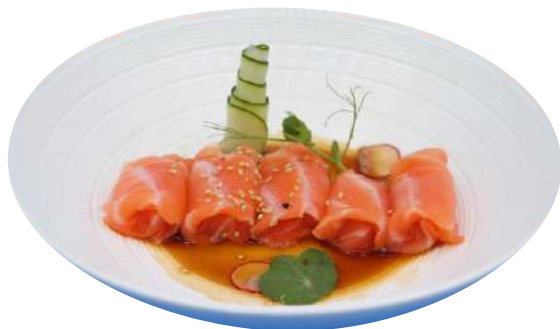
156. Carpaccio di salmone € 7,00