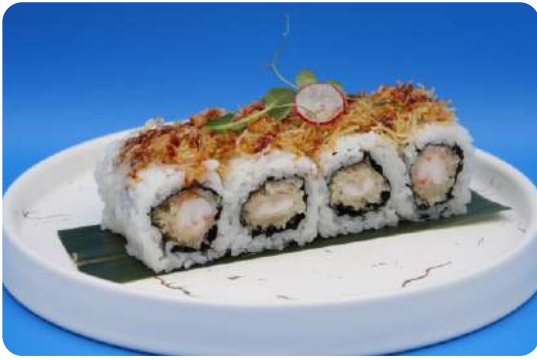
195. Kuni maki tempura di gamberi, tempura di patate € 10,00