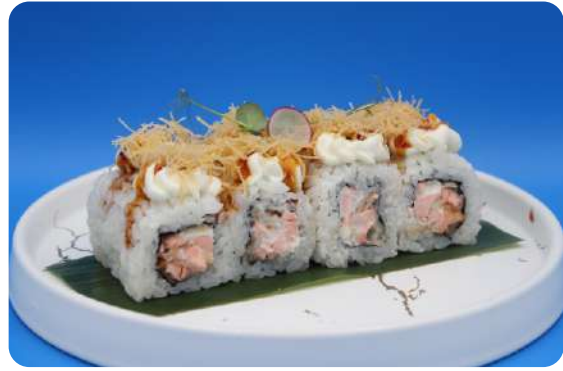
190. Sake tempura maki salmone fritto, philadelphia kataifi € 11,00