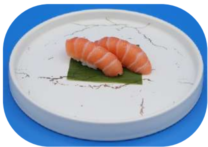
111. Salmone € 3,50