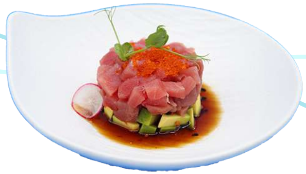
106. Tartare Tonno tonno, avocado tagliato € 10,00