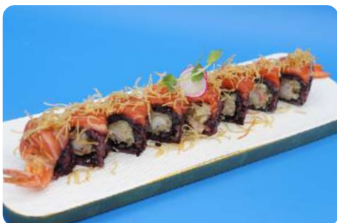
205. Nero tiger maki riso nero, tempura di gamberi, salmone, patate € 12,00