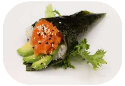
127. Temaki spicy salmone € 3,50