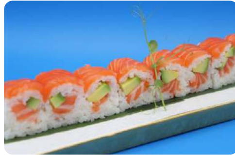
202. White sake maki (senza alghe) salmone, avocado € 10,00