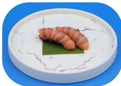
118. Riso nero salmone € 3,50