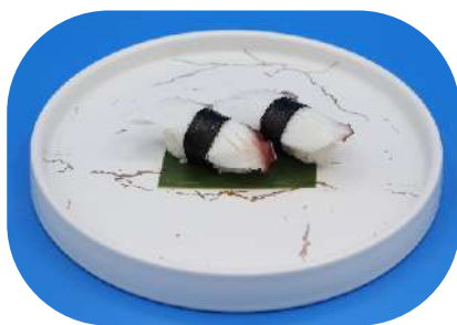
115. Polpo € 3,50