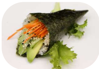
134. Temaki vegetariano € 3,00