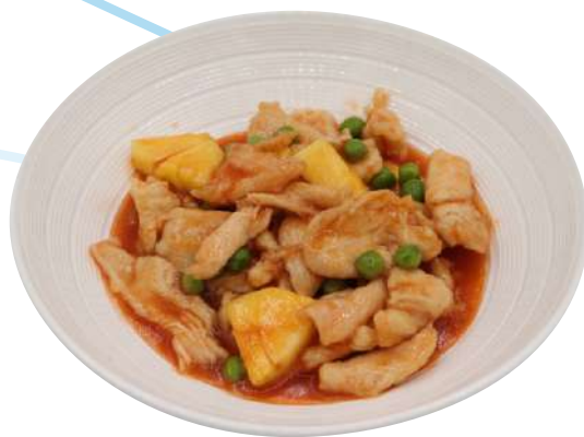
69. Pollo agrodolce pollo, ananas, piselli € 6,00