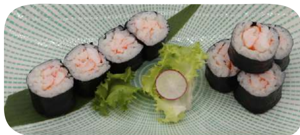
210. Hosomaki gamberi cotti € 5,00