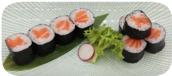
207. Hosomaki salmone € 5,00