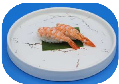
114. Gamberi cotti € 3,50