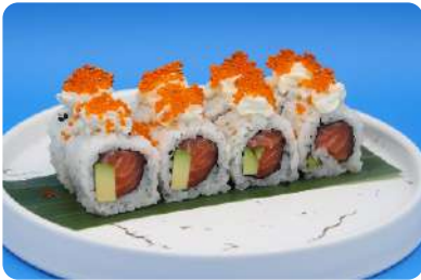
170. Philadelphia maki salmone, avocado, philadelphia, tobiko € 9,00