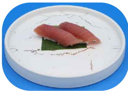
112. Tonno € 3,50