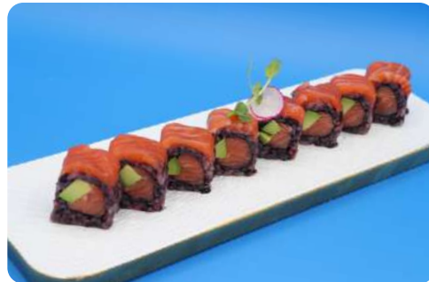
204. Nero sake maki riso nero, interno salmone e avocado, esterno salmone € 12,00