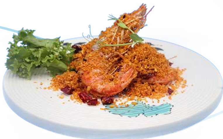
310. Typhoon fried ebi gamberoni croccanti, cereali, aglio, peperoncino 2 pz € 10,00