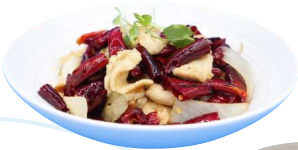
70. Pollo piccante pollo con arachidi € 6,00