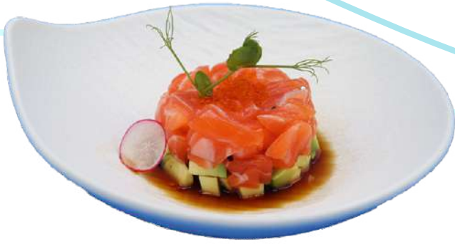
105. Tartare Salmone salmone, avocado tagliato € 9,00