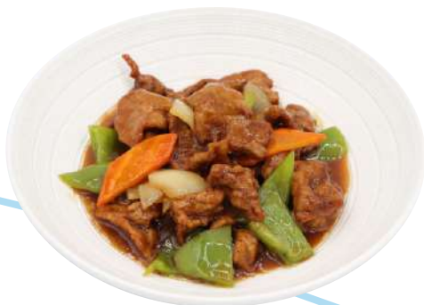
73. Vitello con peperoni e salsa al pepe nero € 8,00