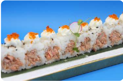
201. White miura maki (senza alghe) salmone cotto, philadelphia € 10,00