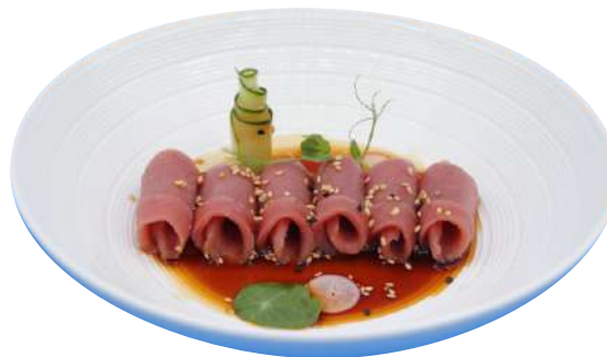
157. Carpaccio di tonno € 7,00