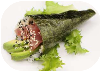
126. Temaki tonno € 3,50