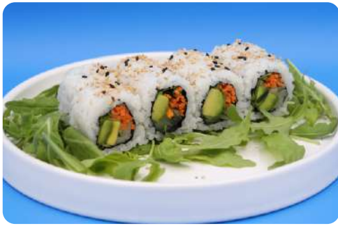
199. Yasai maki avocado, cetriolo, carote € 8,00