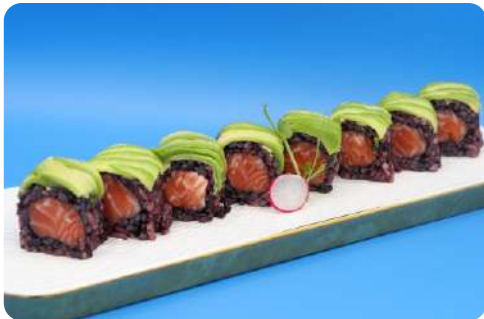
203. Nero salmone avocado maki riso nero, salmone, avocado € 11,00