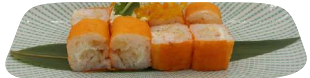
216. Hosomaki tempura gamberi philadelphia € 8,00