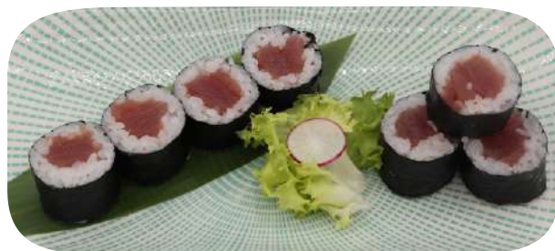
208. Hosomaki tonno € 5,00