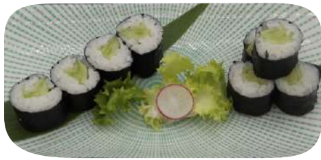
213. Hosomaki cetriolo € 4,00