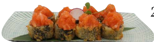
219. Hoso spicy fritto avocado, salmone piccante € 8,00